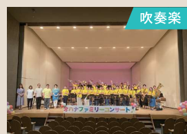
めいとうママ楽団オハナ