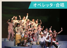
子どもオペラ劇団「瑠璃コパレット」