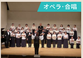
西文化小劇場オペラ合唱団