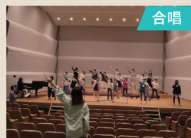
もりっこ彩合唱団