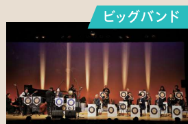
The Polar Star Jazz Orchestra