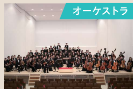
名古屋昭和交響楽団