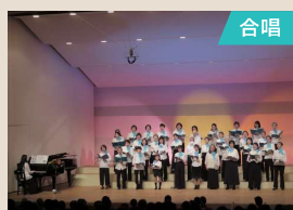
みんなとみなとコーラス